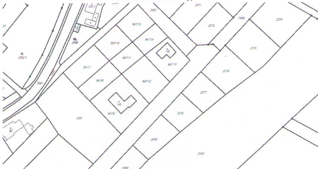
Snímek katastrální mapy

V případě zájmu více žadatelů o jednu parcelu rozhoduje datum a čas podání žádosti.